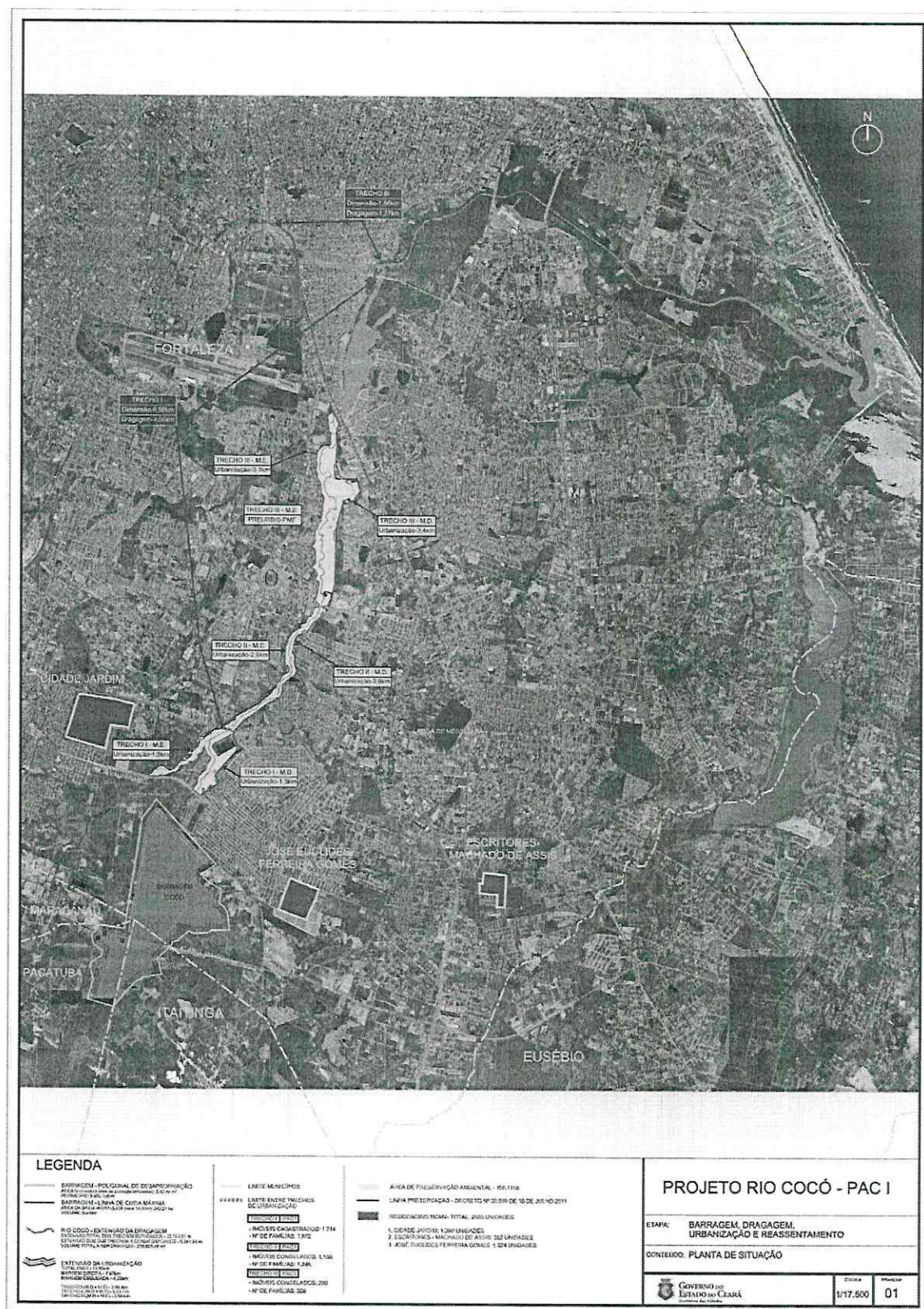
Figura 01 – Visão Geral Projeto Rio Cocó.