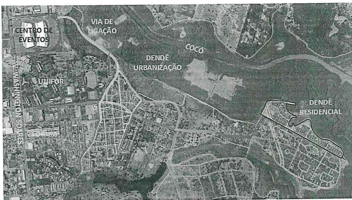
Figura 02 – Visão Geral Projeto Dendê.