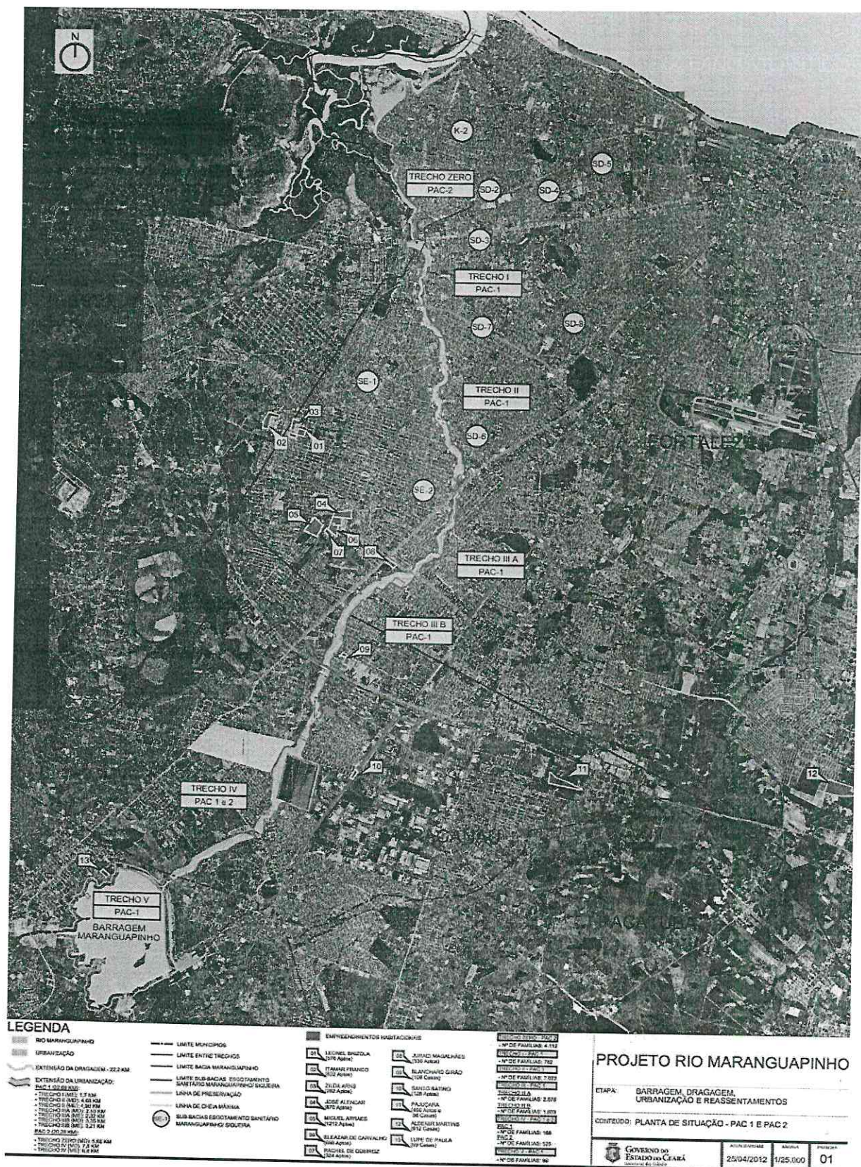
Figura 03 – Visão Geral Projeto Maranguapinho.