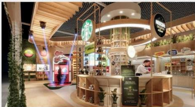
ÁREA DE VENDAS E EXPOSIÇÃO DE PRODUTOS