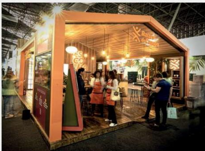
ESTANDE RAÍZES DO CAMPO